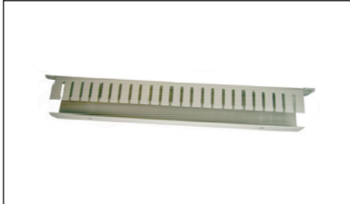
SP-FP-GUIDE-1U Underhulle / fiberordner 1U med 5U plastdeksel

For enklere installasjon, bedre administrasjon og beskyttelse av snorer, anbefales følgende tilbehør. Se eget datablad for mer informasjon om disse.