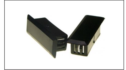
SP-SCDUPLEXBLANK - SC Duplex blindplugg