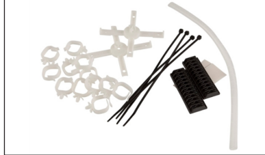
SP-PKIT1- Installasjonskit for FP15