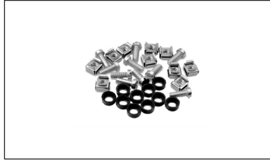
SP-RACKSKRUER-150 - Rackskruer med plastskiver og muttere